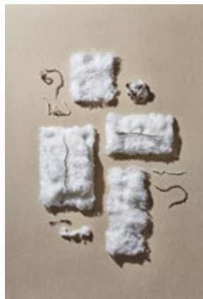
Laine Merinos Fibre naturelle d'origine animale aux excellentes propriétés isolantes qui permettent de conserver la température corporelle idéale durant toute la nuit.