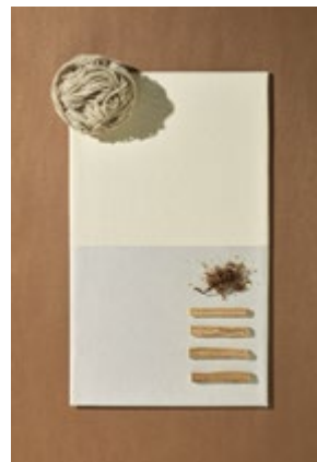
Trois fibres naturelles pour en former qu'une. Coutil dont la combinaison de la laine, du coton et de la viscose ont des propriétés inégalées telles que le Coutil est 100% biologique, recyclable et biodégradable.