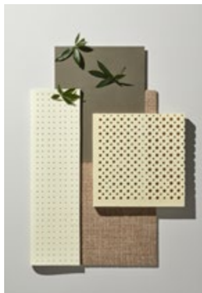
Latex D'origine végétale, c'est une émulsion de la sève de l'hévéa qui possède d'excellentes propriétés d'élasticité, est hydrofuge, imperméable, isolante pour les températures et de grande durabilité.